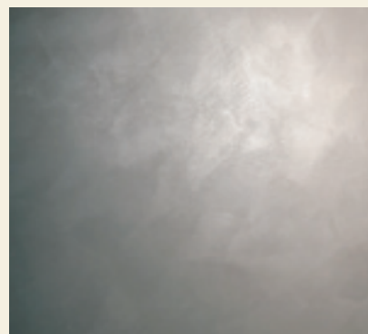
WOOL - Lasciare asciugare. Una eventuale seconda mano rende l'effetto più opaco e omogeneo Let dry. A second layer is possible and it gives a more matt and homogenous effect